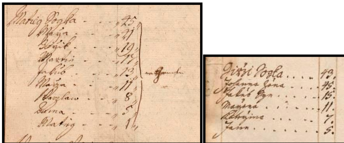
Obr. XX Seznam poddaných panství Červené Pečky z let 1711 a 1735