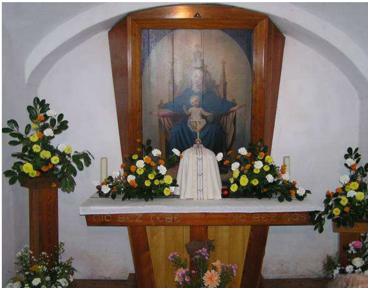
Čerpání vody ze studánky: