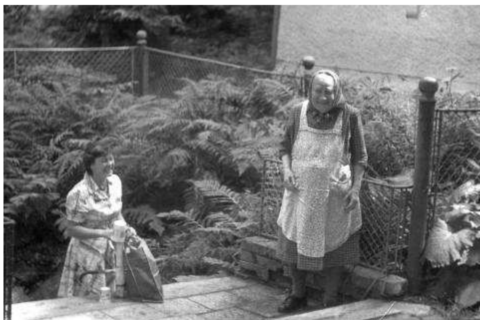
Nejen nemocný a starý, ale i zdravý řád občerství se douškem chladné vody!