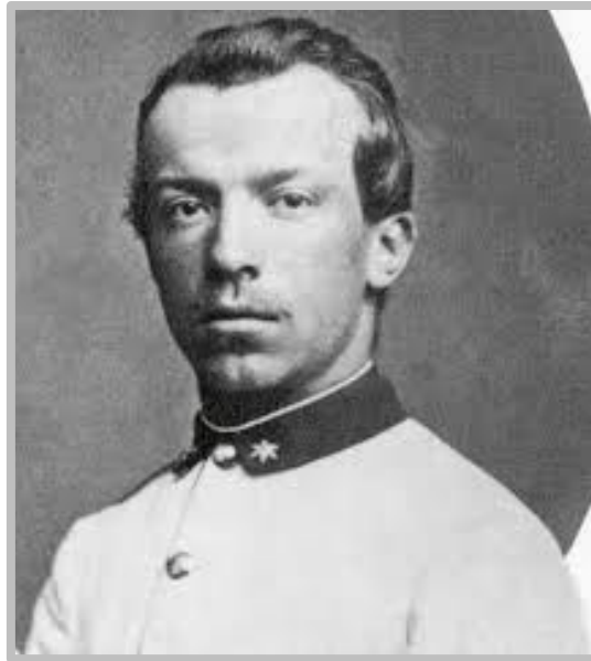
Quido Battaglia (1846–1915)

Trochu mě sice zarazila poslední věta, ale budiž. Zvládla jsem pouze první díl této historické minisérie a další díly jsem si nechala ujít. Chvillemi jsem měla pocit, že v malé obměně sleduji seriál Bridgertonovi zasazený do období českého národního obrození.