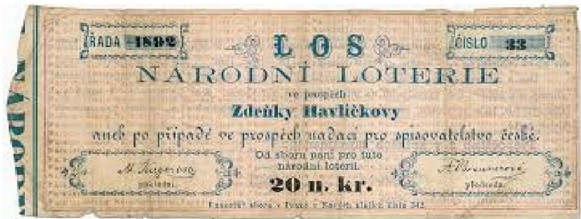
Národní loterie ve prospěch Zdeňky Havlíčkové

Zdeňka zemřela velmi mladá, v nedožitých čtyřiaadvaceti letech. Neměla možnost rozhodovat sama o svém osudu – stala se rukojmím národa, který si ji vyvolil za svoji dceru. Národ se jí složil na věno a za to očekával vděk a poslušnost. Její láska (nebo zamilovanost?) k rakouskému důstojníkovi pobouřila všechny poctivé vlastence.